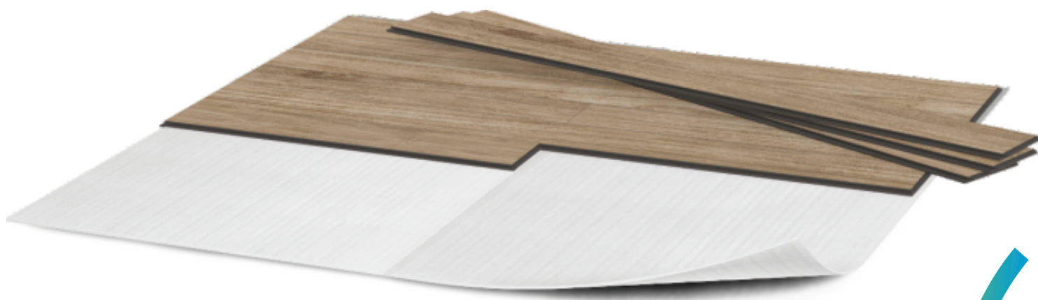
TABELA DE DIMENSÕES - ARMACOMFORT PISO LAMINADO